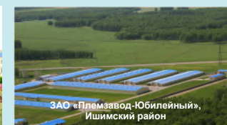
ЗАО «Племзавод-Юбилейный», Ишимский район

Уполномоченный орган исполнительной власти Тюменской области, ответственный за реализацию Программы — Департамент труда и занятости населения Тюменской области 625000, г. Тюмень, ул. Советская, д. 61, каб. 101, тел. (3452) 42-62-51, 42-62-48 e-mail: dep_zan@72to.ru