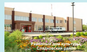
Районный дом культуры, Сладковский район